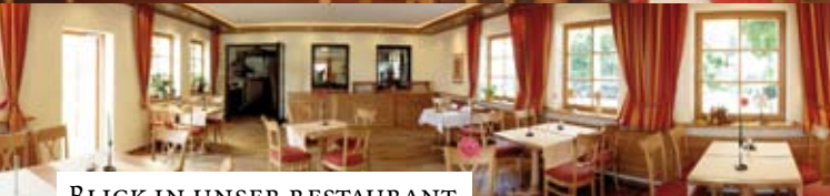
BLICK IN UNSER RESTAURANT